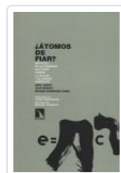
ATOMOS DE FIAR BENACH, JOAN