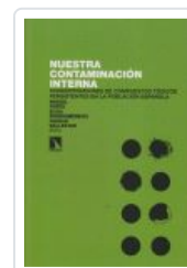
NUESTRA CONTAMINACION INTERNA PORTA, MIQUEL