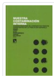
NUESTRA CONTAMINACION INTERNA PORTA, MIQUEL