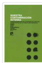
NUESTRA CONTAMINACION INTERNA PORTA, MIQUEL