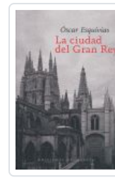
CIUDAD DEL GRAN REY ESQUIVIAS, OSCAR