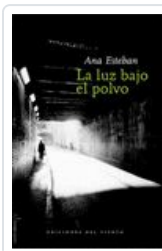
LUZ BAJO EL POLVO ESTEBAN, ANA