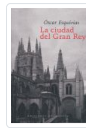
CIUDAD DEL GRAN REY ESQUIVIAS, OSCAR