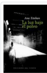
LUZ BAJO EL POLVO ESTEBAN, ANA