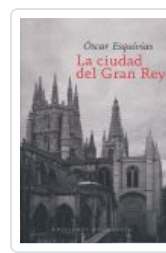
CIUDAD DEL GRAN REY ESQUIVIAS, OSCAR