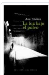
LUZ BAJO EL POLVO ESTEBAN, ANA