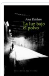
LUZ BAJO EL POLVO ESTEBAN, ANA