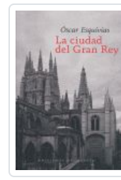
CIUDAD DEL GRAN REY ESQUIVIAS, OSCAR