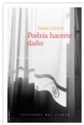
PODRIA HACERTE DAÑO CASTRO, LUISA