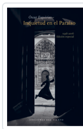
INQUIETUD EN EL PARAISO ESQUIVIAS, OSCAR