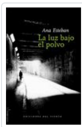
LUZ BAJO EL POLVO ESTEBAN, ANA