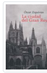
CIUDAD DEL GRAN REY ESQUIVIAS, OSCAR