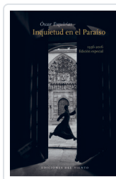
INQUIETUD EN EL PARAISO ESQUIVIAS, OSCAR