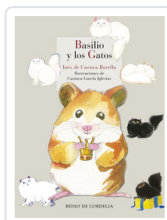
BASILIO Y LOS GATOS DE CUENCA, INES