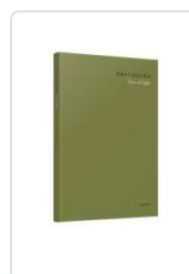
TREE OF LIGHT AA.VV.