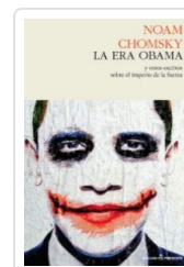
ERA OBAMA, LA ERA OBAMA CHOMSKY, NOAM