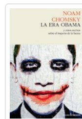
ERA OBAMA, LA CHOMSKY, NOAM