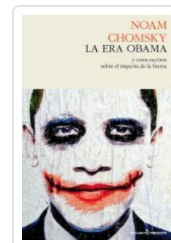
ERA OBAMA, LA CHOMSKY, NOAM