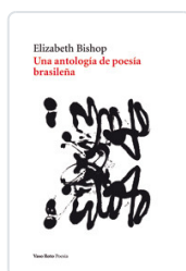
UNA ANTOLOGIA DE POESIA BRASILEÑA BISHOP, ELIZABETH