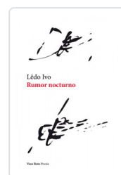
RUMOR NOCTURNO IVO, LEDO