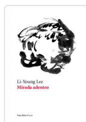
MIRADA ADENTRO LI-YOUNG LEE