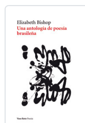
UNA ANTOLOGIA DE POESIA BRASILEÑA BISHOP, ELIZABETH