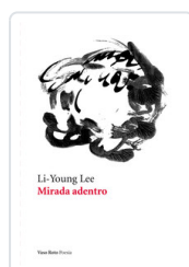
MIRADA ADENTRO LI-YOUNG LEE