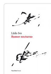
RUMOR NOCTURNO IVO, LEDO