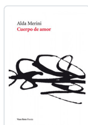
CUERPO DE AMOR MERINI, ALDA