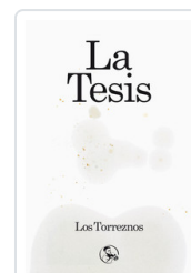
TESIS, LA LOS TORREZNOS