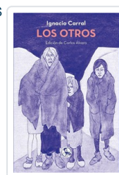
OTROS, LOS CARRAL, IGNACIO