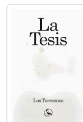
TESIS, LA LOS TORREZNOS