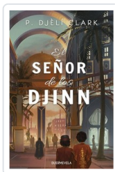
SEÑOR DE LOS DJINN, EL CLARK, P. DJELI