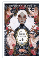
BESTIAS OLVIDADAS DE ELD, LAS MCKILLIP, PATRICIA A.