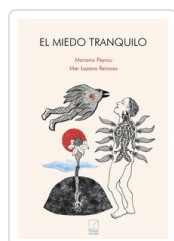
MIEDO TRANQUILO, EL PEYROU, MARIANO