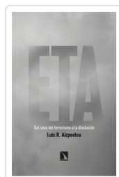
ETA. DEL CESE DEL TERRORISMO A LA DISOLUCION AIZPEOLEA, LUIS R.