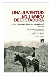
UNA JUVENTUD EN TIEMPOS DE DICTADURA AA.VV.