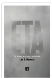
ETA. DEL CESE DEL TERRORISMO A LA DISOLUCIÓN AIZPEOLEA, LUIS R.