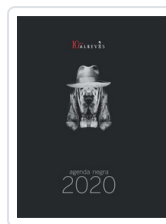
AGENDA NEGRA 2020 AA.VV (AGENDA)