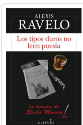
TIPOS DUROS NO LEEN POESIA, LOS RAVELO, ALEXIS