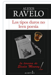
TIPOS DUROS NO LEEN POESIA, LOS RAVELO, ALEXIS