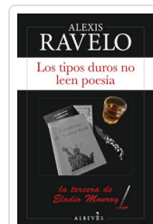
TIPOS DUROS NO LEEN POESIA, LOS RAVELO, ALEXIS