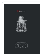
AGENDA NEGRA 2020 AA.VV. (AGENDA)