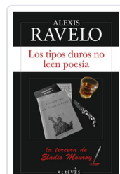
TIPOS DUROS NO LEEN POESIA, LOS RAVELO, ALEXIS