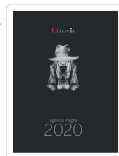
AGENDA NEGRA 2020 AA.VV. (AGENDA)