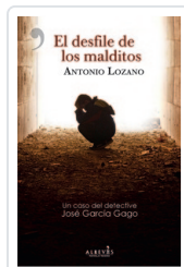
DESFILE DE LOS MALDITOS LOZANO, ANTONIO