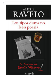
TIPOS DUROS NO LEEN POESIA, LOS RAVELO, ALEXIS