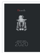
AGENDA NEGRA 2020 AA.VV (AGENDA)