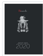
AGENDA NEGRA 2020 AA.VV (AGENDA)