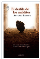
DESFILE DE LOS MALDITOS LOZANO, ANTONIO