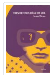
TRESCIENTOS DIAS DE SOL GRASA, ISMAEL