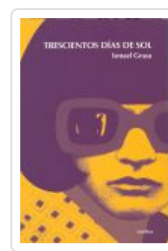
TRESCIENTOS DIAS DE SOL GRASA, ISMAEL