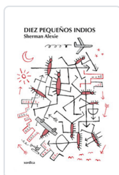
DIEZ PEQUEÑOS INDIOS SHERMAN, ALEXIE