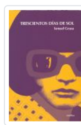
TRESCIENTOS DIAS DE SOL GRASA, ISMAEL