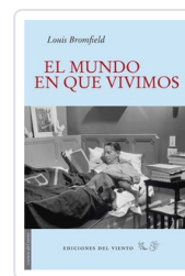
MUNDO EN QUE VIVIMOS BROMFIELD, LOUIS