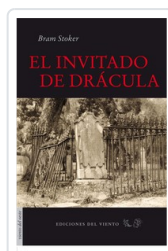
INVITADO DE DRACULA STOKER, BRAM