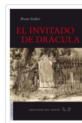
INVITADO DE DRACULA STOKER, BRAM