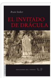
INVITADO DE DRÁCULA STOKER, BRAM