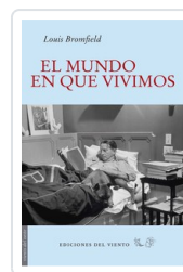
MUNDO EN QUE VIVIMOS BROMFIELD, LOUIS