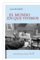
MUNDO EN QUE VIVIMOS BROMFIELD, LOUIS