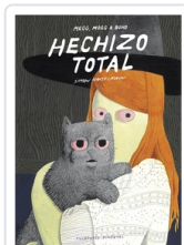
** HECHIZO TOTAL HANSELMANN, SIMON