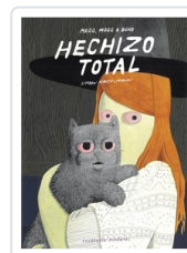
** HECHIZO TOTAL HANSELMANN, SIMON