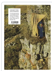
** HECHIZO TOTAL HANSELMANN, SIMON