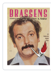
BRASSENS LA LIBERTAD SFAR, JOANN