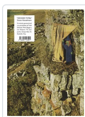
** HECHIZO TOTAL HANSELMANN, SIMON