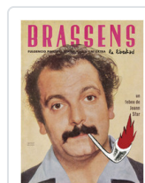
BRASSENS LA LIBERTAD SFAR, JOANN