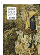
** HECHIZO TOTAL HANSELMANN, SIMON