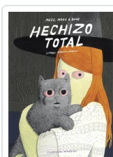
** HECHIZO TOTAL HANSELMANN, SIMON