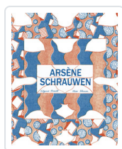
ARSENE SCHRAUWEN, 1 SCHRAUWEN, OLIVIER