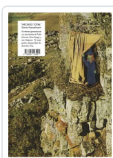
** HECHIZO TOTAL HANSELMANN, SIMON