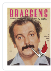
BRASSENS LA LIBERTAD SFAR, JOANN