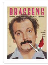
BRASSENS LA LIBERTAD SFAR, JOANN