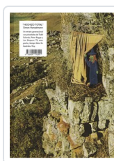
** HECHIZO TOTAL HANSELMANN, SIMON