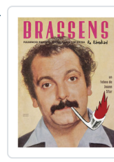
BRASSENS LA LIBERTAD SFAR, JOANN