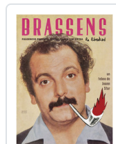
BRASSENS LA LIBERTAD SFAR, JOANN