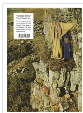
** HECHIZO TOTAL HANSELMANN, SIMON