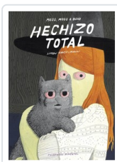
** HECHIZO TOTAL HANSELMANN, SIMON