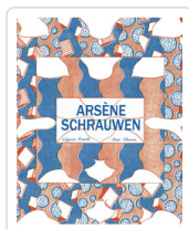
ARSENE SCHRAUWEN, 1 SCHRAUWEN, OLIVIER