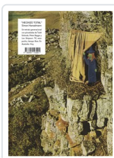
** HECHIZO TOTAL HANSELMANN, SIMON