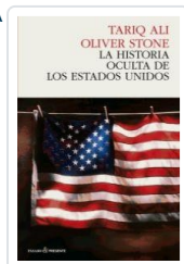
HISTORIA OCULTA DE ESTADOS UNIDOS ALI, TARIQ / STONE, O.