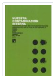
NUESTRA CONTAMINACION INTERNA PORTA, MIQUEL